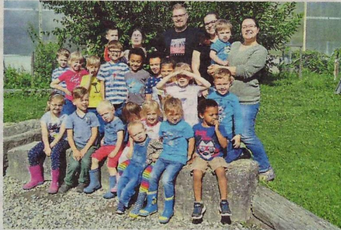
Die Kinder freuen sich auf den Bauernhof...

Übrigens: Am Samstag, 26. August, ist von 11 bis 16 Uhr „Tag der offenen Tür“ im Kinderbauernhof Wiesbaden. An diesem Tag dürfen dann auch Erwachsene den Bauernhof besuchen.